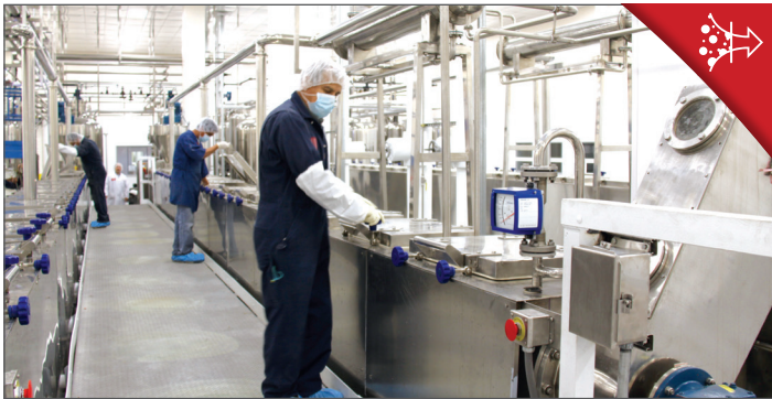
STAP 4. EXTRAHEREN