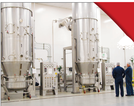
STAP 6. FLO-COATEN