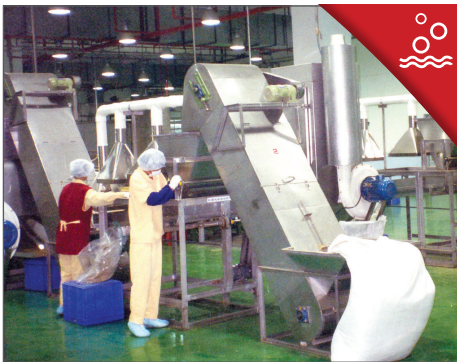
STAP 1. REINIGEN

Het ultra-exacte productieproces van Sunrider onderscheidt onze producten van die van de concurrentie.