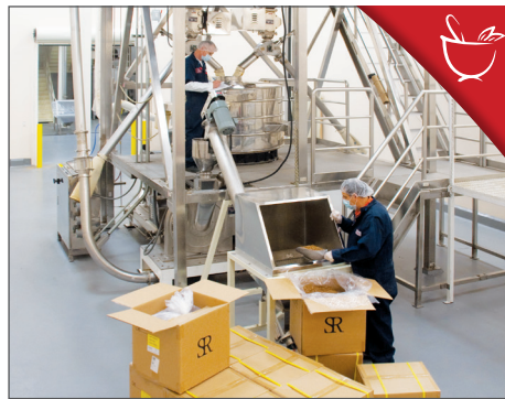
STAP 2. MALEN