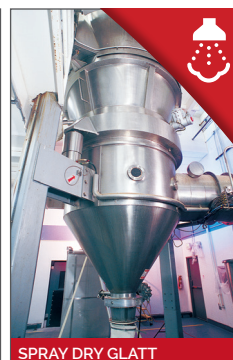
SPRAY DRY GLATT