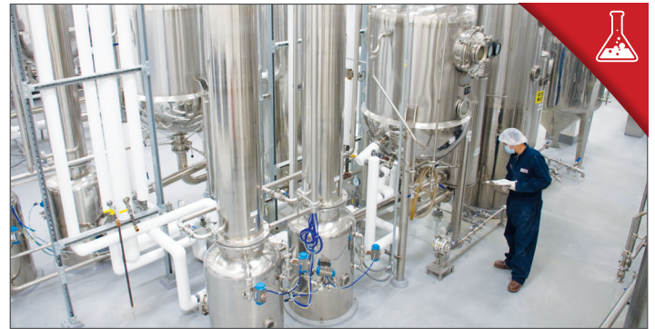
STAP 5. CONCENTREREN