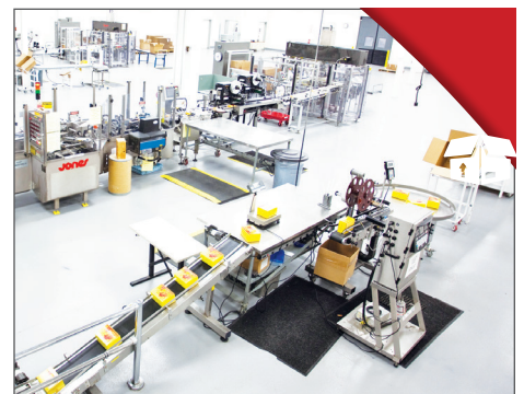
STAP 8. VERPAKKEN