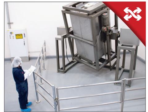
STAP 3. SAMENSTELLEN